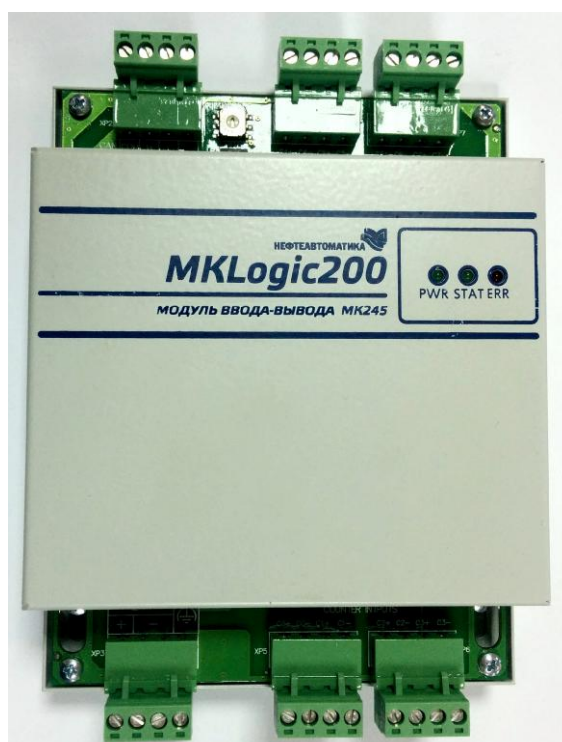
Модуль ввода-вывода МК245