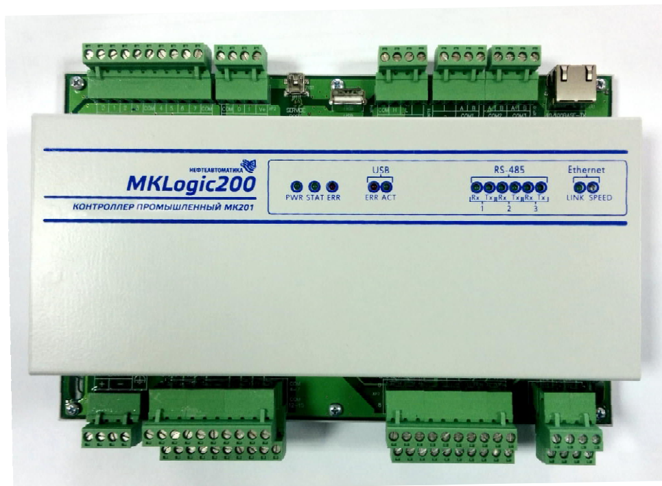
Промышленный контроллер МК201