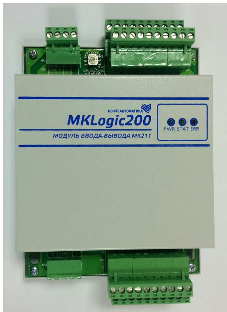
Модуль ввода-вывода МК211