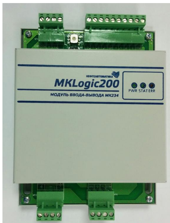
Модуль ввода-вывода МК234